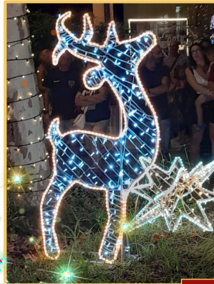
Renne e Stelle